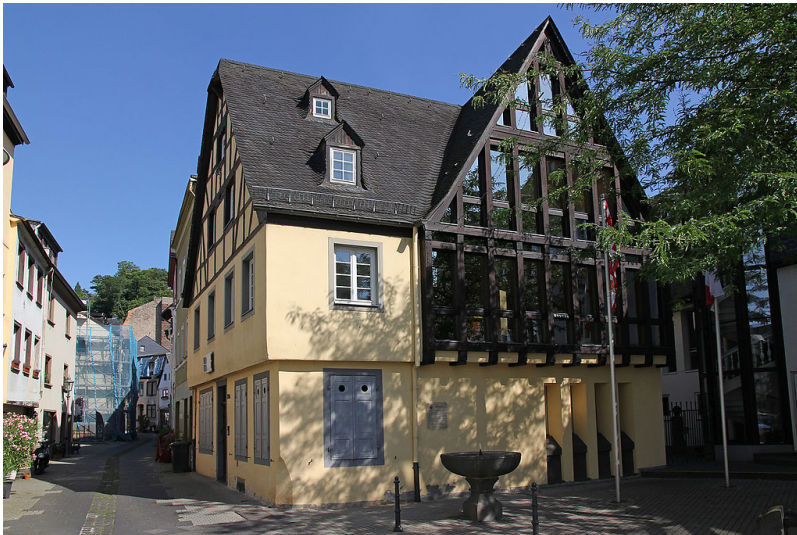
Das Mutter-Beethoven-Haus in Koblenz-Ehrenbreitstein (2013).