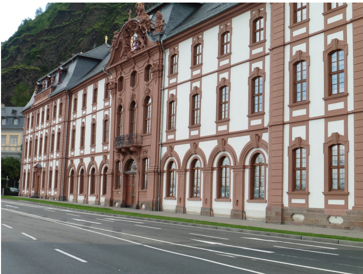
Das Dikasterialgebäude (Dikasterium) der früheren kurfürstlichen Residenz in Koblenz-Ehrenbreitstein (2014).