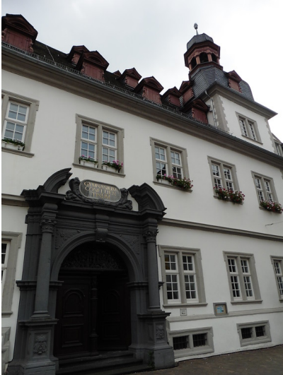
Das frühere Jesuiten-Gymnasium (Jesuitenkolleg), heute Rathaus der Stadt Koblenz (2014).