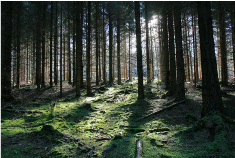
Fichten im Münsterwald, Nordeifel (2008)