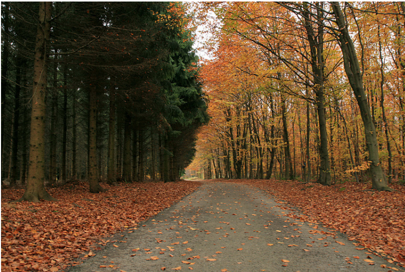
Das Bild zeigt einen Wanderweg in der Nähe des Dreiländerpunktes südwestlich von Aachen, gesäumt von Nadelwald auf der linken Seite und von Laubwald auf der rechten Seite des Weges (2008)