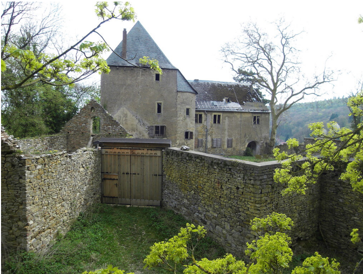
Burg Gollenfels bei Dörrebach (2009)