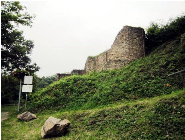
Teilansicht der Burgruine auf dem Pfarrköpfchen in Stromberg im Hunsrück (2014).