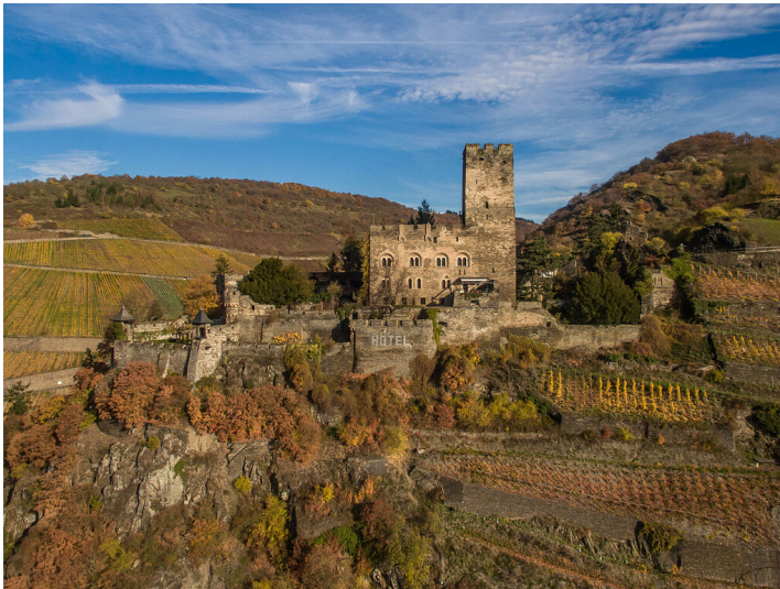
Burg Gutenfels oberhalb von Kaub (2015)