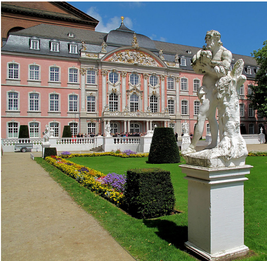
Blick vom Palastgarten aus auf das spätbarocke kurfürstliche Palais in Trier (2009).