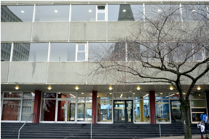
Teilansicht der östlichen Frontfassade der Viktoriaschule in Aachen (2014)