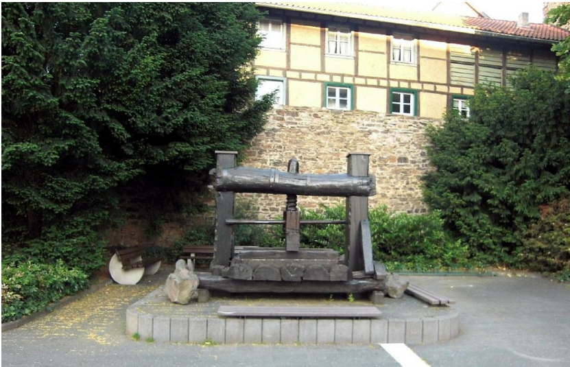
Schraubenkelter aus Holz beim Niedertor in Ahrweiler (2014)