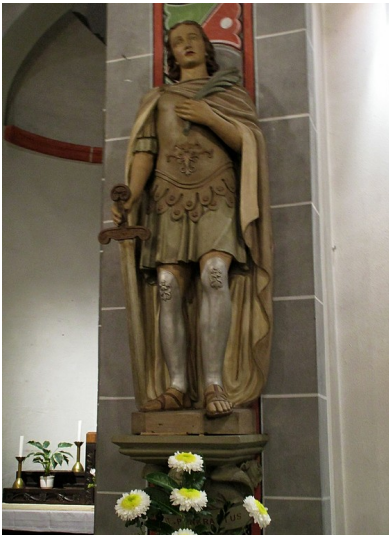
Steinerne Figur des heiligen Pankratius (2015).