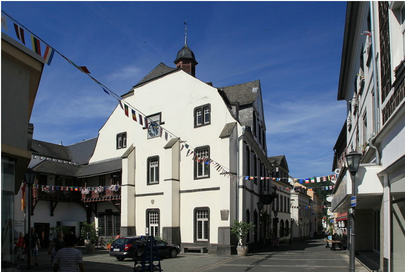
Das Alte Rathaus in der Andernacher Altstadt (2014); im Keller des Gebäudes befindet sich ein jüdisches Ritualbad (Mikwe) und neben dem Rathaus das Salzmagazin.