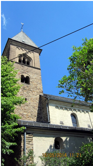
Teilansicht der alten St. Servatius-Kirche in Koblenz-Güls (2014)