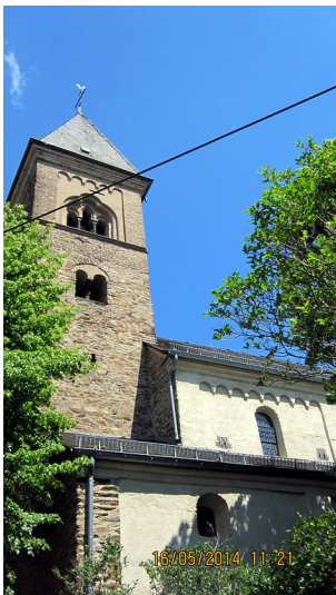
Teilansicht der alten St. Servatius-Kirche in Koblenz-Güls (2014)