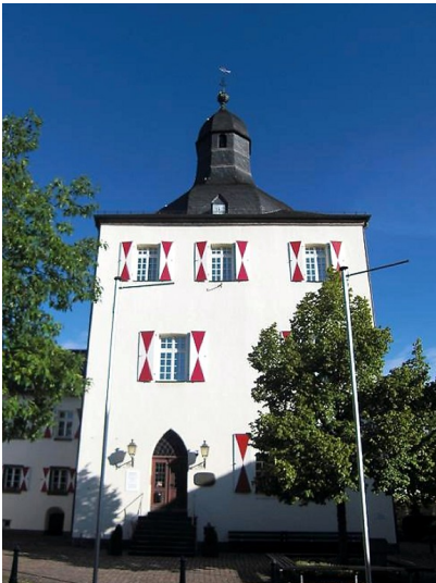
Der Weiße Turm in der Ahrweiler Altstadt (2014)