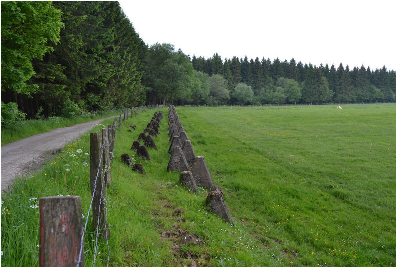
Höckerlinie am Hollerather Knie in Hellenthal, Blick nach Nordwesten (2014)