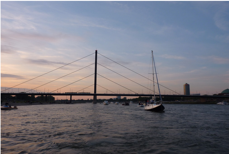
Die Oberkasseler Brücke in Düsseldorf in der Südansicht