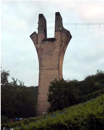
Brückenpfeiler der unvollendeten Eisenbahnbrücke im Adenbachtal bei Ahrweiler (2014)