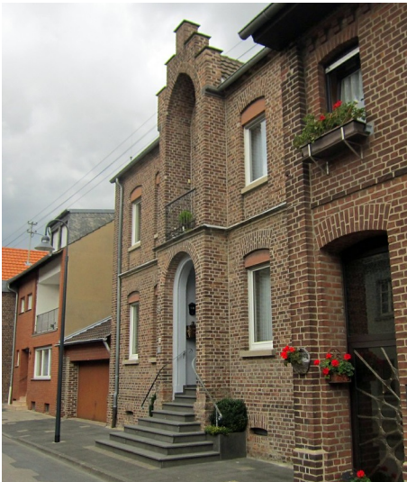
Das ehemalige Pfarrhaus in der Broichstraße in Hülchrath (2014)