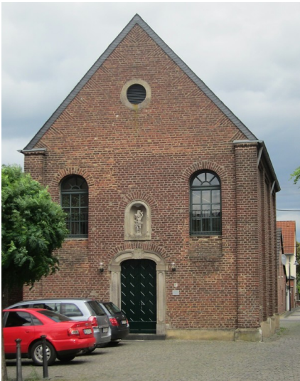
Die Sankt Sebastianuskapelle in Hülchrath vom Sebastianusplatz aus (2014)