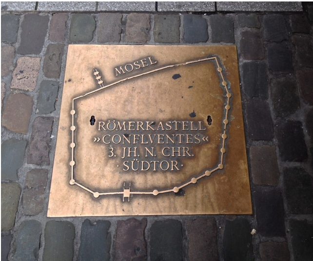
Im Koblenzer Straßenpflaster eingelassene Informationstafel mit einem schematischem Plan des spätrömischen Römerkastells "Confluentes" und des Südtors (2014).