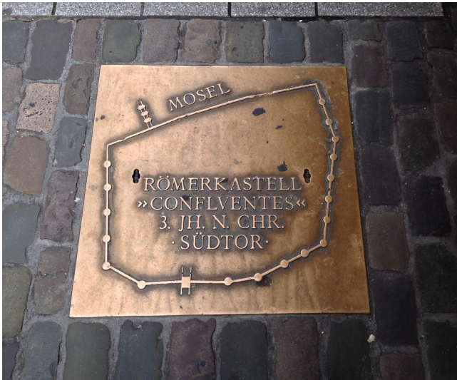
Im Koblenzer Straßenpflaster eingelassene Informationstafel mit einem schematischem Plan des spätrömischen Römerkastells "Confluentes" und des Südtors (2014).