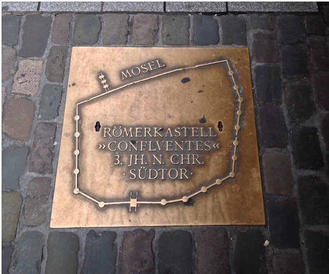
Im Koblenzer Straßenpflaster eingelassene Informationstafel mit einem schematischem Plan des spätromischen Römerkastells "Confluentes" und des Südtors (2014).