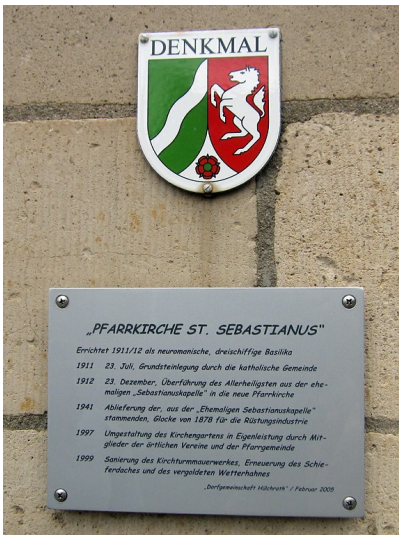
Denkmalplakette und eine Informationstafel an der Sankt Sebastianuskirche in Grevenbroich-Hülchrath (2014).