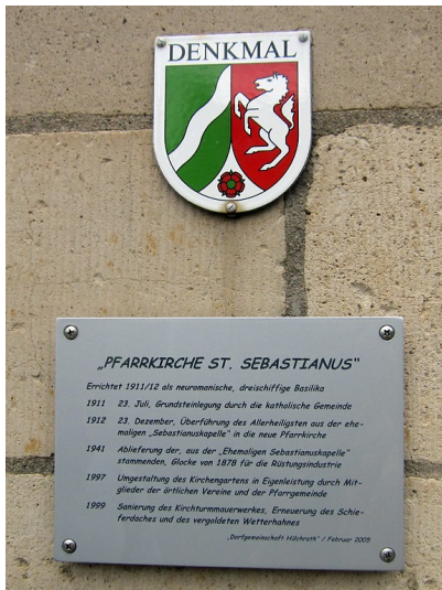
Denkmalplakette und eine Informationstafel an der Sankt Sebastianuskirche in Grevenbroich-Hülchrath (2014).