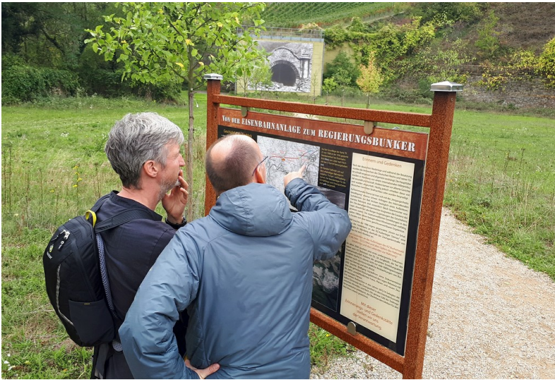
Informationstafel zum Regierungsbunker bei Ahrweiler-Marienthal, im Hintergrund der frühere Trotzenbergtunnel (2019).