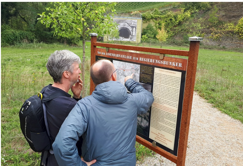
Informationstafel zum Regierungsbunker bei Ahrweiler-Marienthal, im Hintergrund der frühere Trotzenbergtunnel (2019).