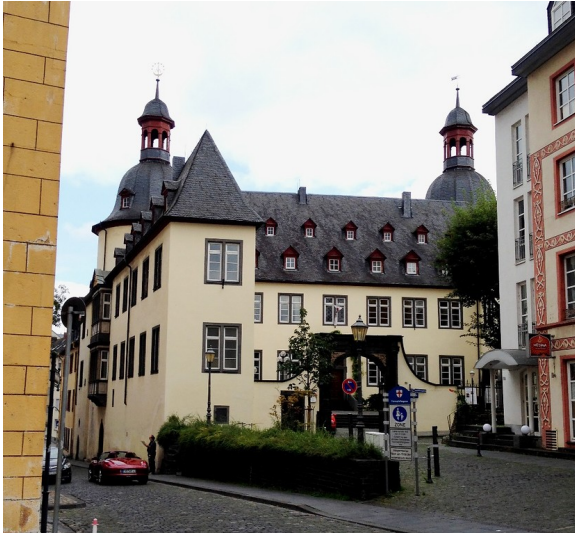
Historischer Gebäudekomplex "Auf der Danne" in Koblenz (2014)