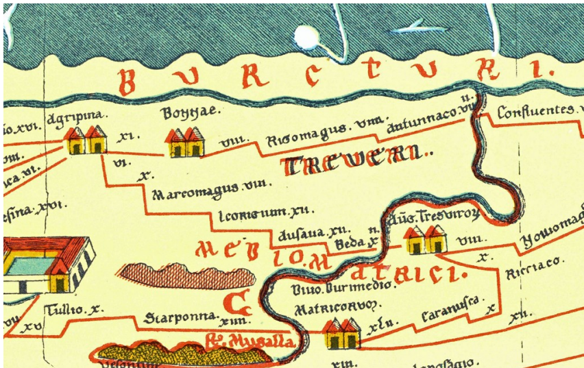
Ausschnitt aus der "Tabula Peutingeriana" mit dem Raum zwischen Köln, Koblenz und Trier.