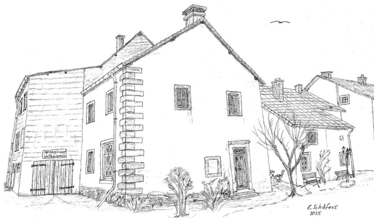
Heutiger Zustand des ehemaligen kleinen südlichen Querflügels des Oberkailer Schlosses (2026)