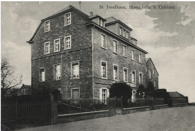
Das St.-Josef-Haus in Horchheim (undatiert, um 1950)