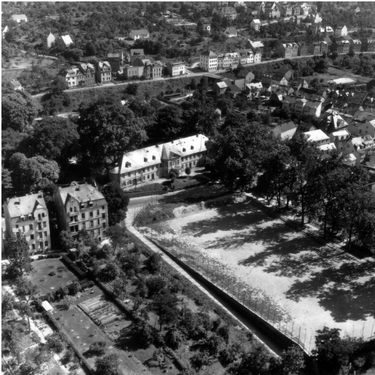
Luftaufnahme des Mendelssohn-Stifts in Koblenz-Horchheim mit dem unteren Teil des Parks, heute Sportplatz (1960)