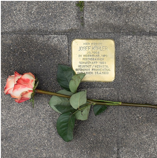
Stolperstein zur Erinnerung an Josef Köhler