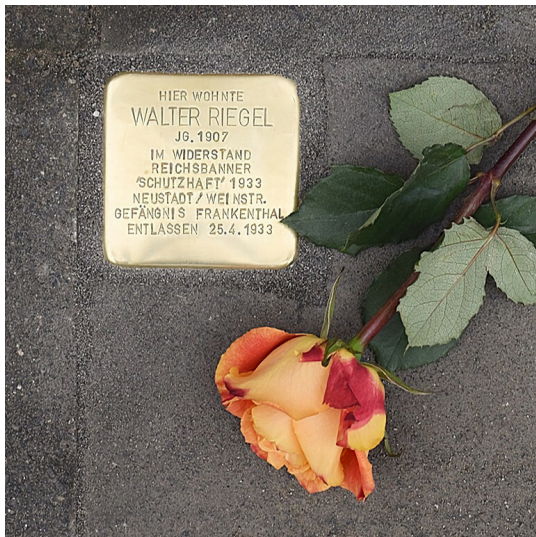
Stolperstein zur Erinnerung an Walter Riegel