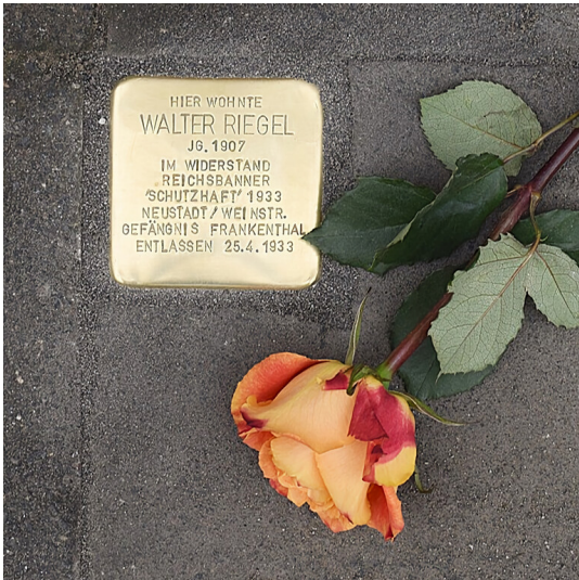
Stolperstein zur Erinnerung an Walter Riegel