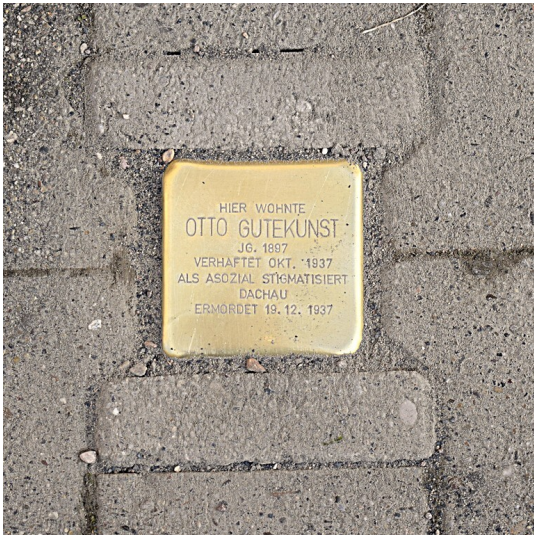
Stolperstein zur Erinnerung an Gutekunst Otto