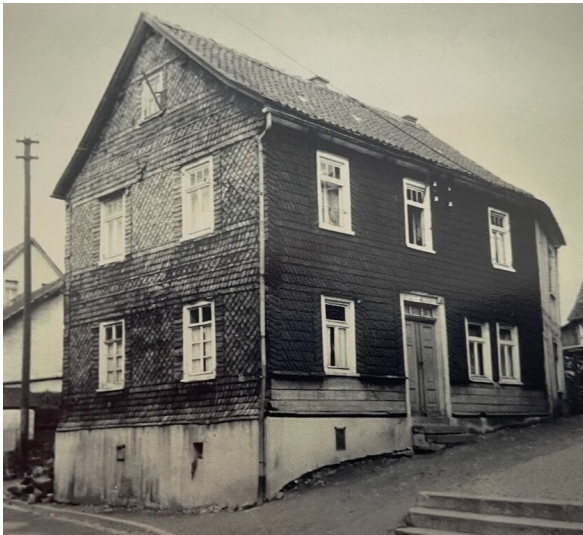
Das Wohnhaus der Eheleute Gunzendörfer in der Scheidterstraße 12 in Hamm (1930er Jahre)