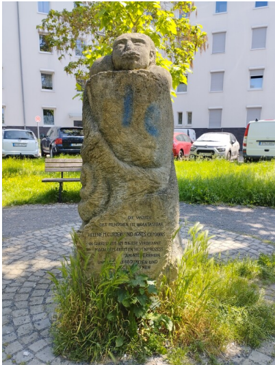
Vorderseite des Kunstwerks "Befreiung" (Gerresheimer Hexenstein) an der Dreherstraße in Düsseldorf-Gerresheim (2026).