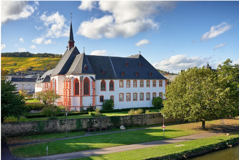
Cusanusstift in Bernkastel-Kues (2019)