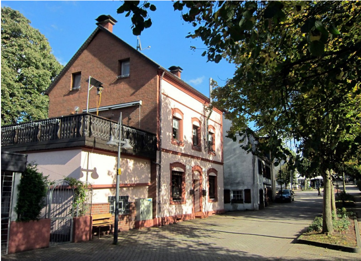
Ältere Gebäude an der Flughafenstraße in Troisdorf-Altenrath (2011)