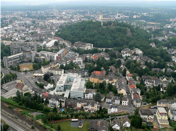
Die Stadt Siegburg mit der Abtei auf dem Michaelsberg, Kreishaus, Polizeiwache und städtischem Mühlengraben im Luftbild (2011)