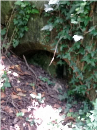
Poterne in der Schafgasse