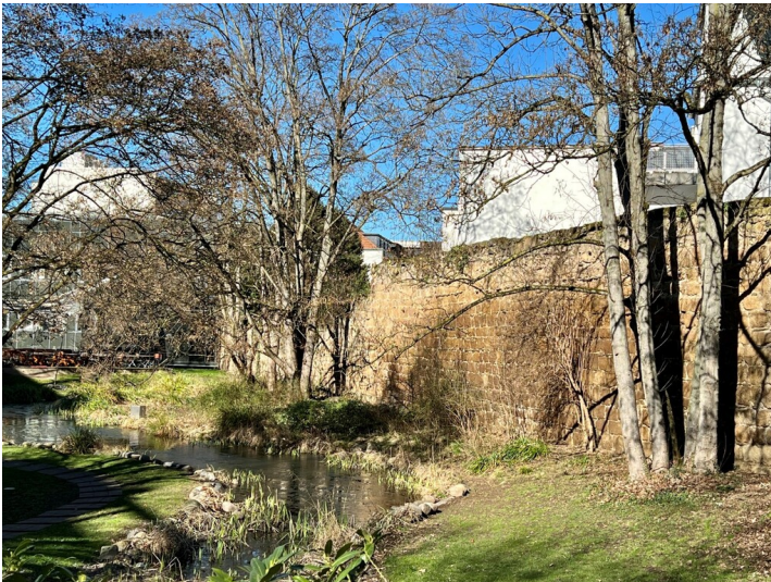
Ein erhaltenes Fragment der Stadtmauer aus dem Hochmittelalter in einem Park nahe des S-Carrés in Siegburg (2026).