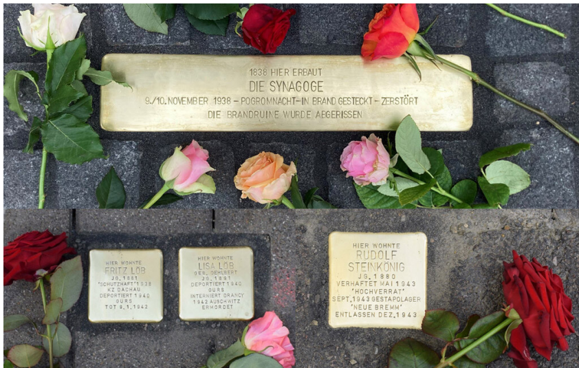
Stolpersteine in Mutterstadt