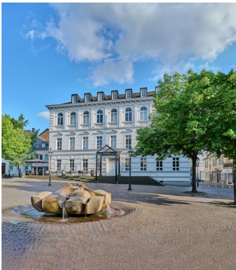
Frontansicht des Stadtmuseums Siegburg vom Marktplatz aus (2023).