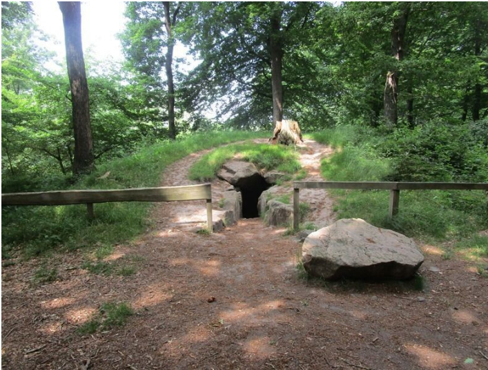
Idstedter Räuberhöhle im Idstedter Wald / Isted Røverhule i Isted Skov (2021)