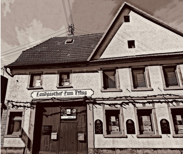
Das Geburtshaus von Philipp Guth, Gasthaus Zum Pflug, in der Hauptstraße 2 in Zeiskam (2026)