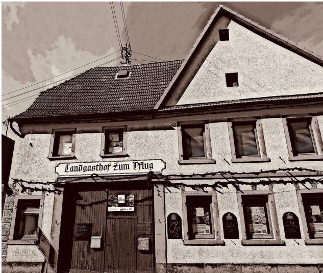
Das Geburtshaus von Philipp Guth, Gasthaus Zum Pflug, in der Hauptstraße 2 in Zeiskam (2026)

Schlagwörter: Wohnhaus Fachsicht(en): Landeskunde Gemeinde(n): Zeiskam Kreis(e): Germersheim Bundesland: Rheinland-Pfalz