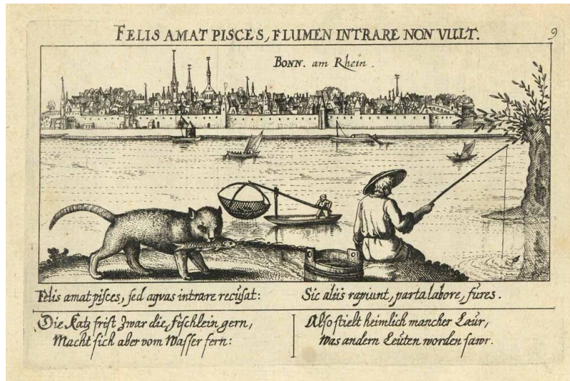
Kupferstich mit einer Stadtansicht von Bonn von der Beueler Seite aus gesehen (16./17. Jhr.)