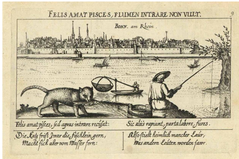
Kupferstich mit einer Stadtansicht von Bonn von der Beueler Seite aus gesehen (16./17. Jhr.)